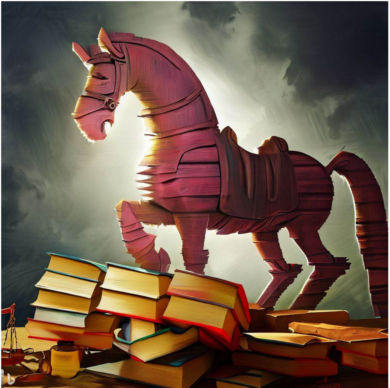
Trojanisches Pferd in den Gesetzestexten