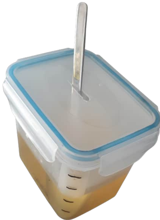
Behälter zum leichteren Transport für ein Getränk unterwegs, hier ein 0,9 l Gefäß. Mit einem wasserunlöslichen

Falls Sie z.B. im Garten oder Park Trinkbares zum Anreichen mitnehmen wollen, so kann ein kleiner Plastikbehälter mit festem Deckel die wohl dann meist angedickte Flüssigkeit zum Transport aufbewahrt werden. In den Deckel kann mittig leicht mit einem Teppichmesser ein kleiner Schlitz für den Löffel gebracht werden.