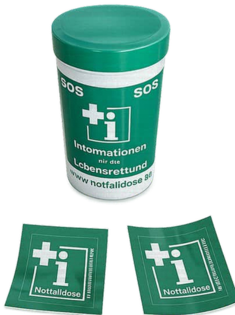
Notfalldose mit zwei Aufklebern

Nehmen Sie das Notfallinfoblatt oder eine Kopie davon auch immer bei einem Arztbesuch oder ins Krankenhaus mit, ebenso die elektronische Gesundheitskarte und das Impfbuch. Es kann da aber auch ein von Ihnen erstellte Information sein. Diese Dose erhalten Sie in einer Apotheke oder über das Internet.