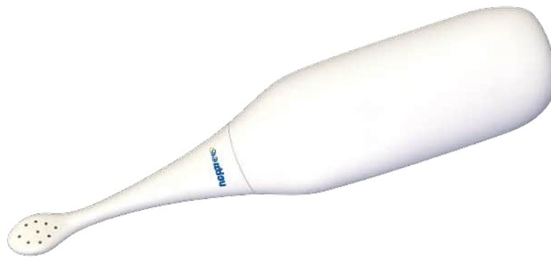
Beispiel einer Podusche

Diese ist ca. 30 cm lang und besteht aus einem ovalen, elastischen Körper, der mit warmen Wasser gefüllt werden kann. Daran schließt sich ein abschraubbares Röhrchen an. Das Ende hat seitlich einen kleinen Duschkopf. Da dieser Artikel preisgünstig ist, könnten praktischerweise mehrere angeschafft werden. Die Podusche ist eine Alternative zu Feuchtigkeitstücher und ermöglicht eine sanfte Reinigung.