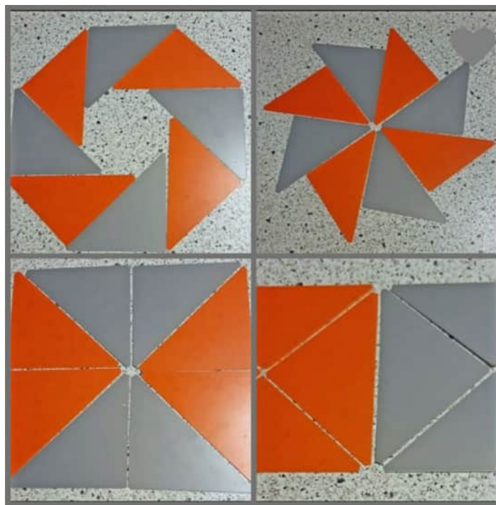
Möglichkeiten, die Dreiecke zu legen

Vorbereitung: 2 Quadrate einer Farbe mit z.B. 5 cm Kantenlänge, 2 Quadrate einer anderen Farbe; Material: z.B. Pappe oder dünne Kunststoffplatten, Moosgummi. Die Quadrate schneiden Sie diagonal. Vielleicht hat der von Ihnen betreute Mensch schon einmal Muster oder ein Puzzle gelegt. Sie können zuerst langsam einfache Muster mit den Dreiecken legen. Es kann sein, dass Ihr gegenüber es selber probieren möchte. Später können Sie zur Anregung kompliziertere Muster legen. Reden Sie so wenig wie möglich, lassen Sie die Muster selber "sprechen". Allgemein: Für den Behinderten ist es günstiger, nur über eine Sinneswahrnehmung Eindrücke aufzunehmen, entweder über das Sehen, indem ich wortlos die Muster lege, oder über das Hören: "Ein Muster legen", "Du kannst ruhig weitermachen", "Gut so!" Falls etwas ganz anderes gelegt wird, als das was Sie ausgedacht habe, so ist das auch gut.