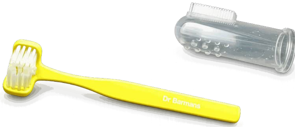
Dreiseitige Zahnbürste und Fingerling mit Bürstenaufsatz

Sie könne auch einen Fingerling mit einem Bürstenaufsatz probieren. Vorsicht ist hier geboten, wenn die Innenseite der Zähne geputzt werden, der Patient könnte versehentlich zubeißen.