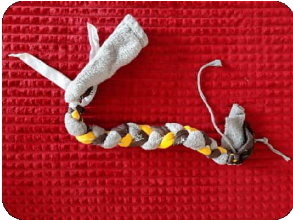
Selbst hergestellter Zopf aus drei unterschiedlichen Stoffen zum Nesteln

Sie können aber auch selbst Gegenstände zum Nesteln herstellen oder sie kaufen, z.B. eine Nesteldecke, einen Nestelpuff. Hier beispielhaft zwei Gegenstände, die Sie selber herstellen können: