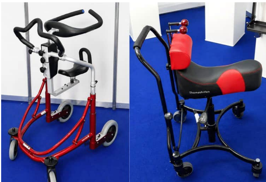
Zwei verschiedene Gehhilfen mit Sattel

Die bekannten Gehhilfen haben nicht die Möglichkeit einer Sitzgelegenheit. Diese kann bei motorisch noch fitten Menschen ausreichend sein. Möchte sich aber der gehandikapte Mensch während des Laufens ausruhen oder sich sicherer fühlen, kann das Vorhandensein eines Sattels behilflich sein. Außerdem verleiht es eine Stabilität des Körpers und kann dadurch leichter angenommen werden. Eine Begleitperson soll zur Sicherheit dabei sein. 6 Der Gehstuhl stärkt die Muskelkraft, den Kreislauf und den Verdauungstrakt.