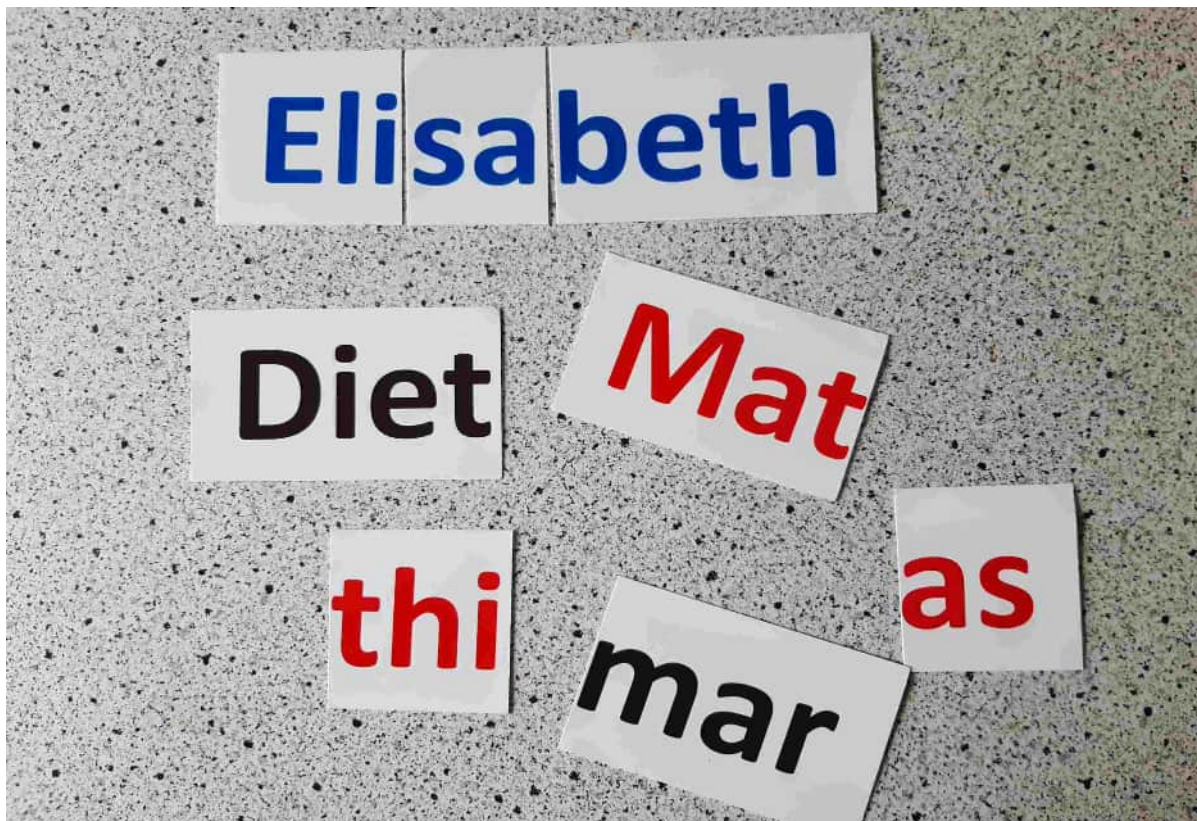
Beispiel für Namensschilder.

Legen Sie der Person auseinander geschnittene, ihr bekannte Namen vor. Ihr eigener Name soll auch dabei sein. Die getrennten Namen sollen dann zusammen gesetzt werden. Dies kann nicht nur das Gedächtnis schulen, sondern auch unterhaltsam sein. Eventuell legen Sie je ein Foto der genannten Personen dazu, die dann dem Namen zugeordnet werden kann. Die Aufgabe soll Aufforderungscharakter haben und nicht einer Prüfungssituation gleichen. Es kann über die betreffenden Personen geredet werden. Sagen und zeigen Sie dabei auf den Namen bzw. das Bild, sprechen ihn aus. Vielleicht ergibt sich daraus eine kleine Geschichte. Korrigieren Sie nicht evtl. Fehler. Sie können ja gelegentlich das Richtige im Gespräch einfließen lassen.