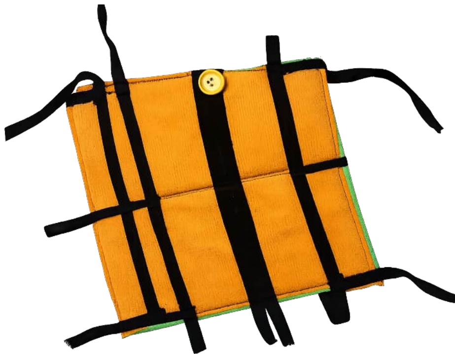
Fühlbuch mit Taschen, Knopf sowie Bändern zum Knoten